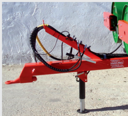
Apoyo hidráulico con bomba.