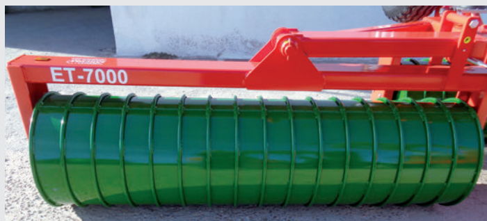
Estrias de aros.